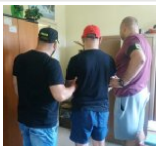
policjanci z zatrzymanym mężczyzną