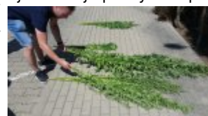
Ścięte krzaki konopi indyjskich

Tego samego dnia kryminalni, w związku z uzyskaną informacją udali się na Białołękę, gdzie w wyniku penetracji na terenie działek ujawnili rośliny konopi indyjskich. Rośliny były w różnej fazie wzrostu, od około 15 cm do około 230 cm., w łącznej ilości 68 sztuk. Po wykonaniu oględzin miejsca konopie zostały ścięte i zabezpieczone.