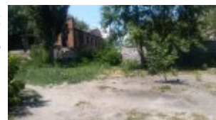
Miejsce ujawnionej uprawy konopi indyjskich

W ubiegły czwartek policjanci z wydziału wywiadowczo - patrolowego na Pradze Północ nadzorowani przez Naczelnika Wydziału podczas działań skierowanych na zwalczanie przestępczości narkotykowej znaleźli na terenie dzielnicy plantację konopi indyjskich. Ich sukces był efektem monitorowania środowiska przestępczego i uzyskanych w ten sposób informacji. Weryfikując te ustalenia mundurowi pojechali pod wytypowany adres. Łącznie na terenie posesji policjanci zabezpieczyli 615 roślin konopi indyjskich w różnych fazach wzrostu, od około 10 cm do około 170 cm. Rośliny zostały zabezpieczone.